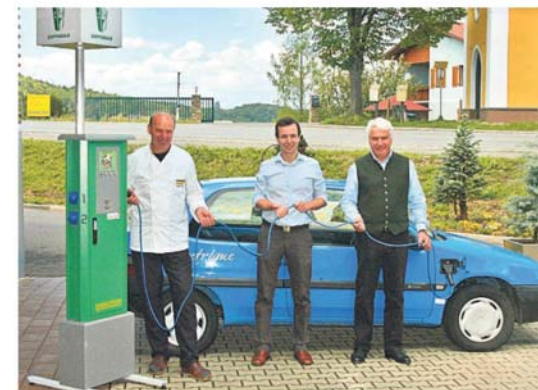
Quasi als Vorhut des riesigen Öko-Projekts eröffnet Zotter im Juni seine Elektrozapfsäule.

Schon bald sollen neun Fotovoltaik-Mover auf dem Gelände hinter dem Werk 99.000 Kilowattstunden Öko-Strom pro Jahr für den Betrieb der Schokolademanufaktur erzeugen. Überschüsse werden ins Netz einge-